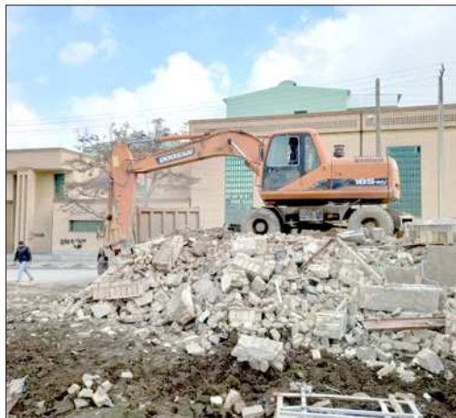
عملیات تخریب ملک و تعریض خیابان ستاره، حدفاصل چهارراه پاستور و خیابان هنرستان

مدیر منطقه یک با اشاره به اینکه ثبت جهانی هگمتانه یکی از مهم ترین رویدادهای گردشگری شهر همدان طی سالیان اخیر است و همچنین هر فرد بایستی از فضای شهری که در آن پیاده روی می کند لذت ببرد عنوان